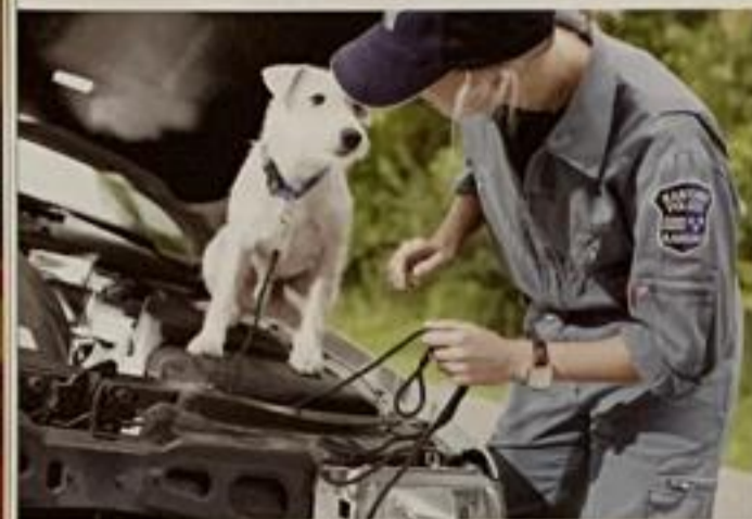
Justy (voir texte éducation)

Selon le règlement Agility de la SCS, l'agility se pratique en différentes catégories et en différentes classes de performance. La catégorie du chien est définie par sa hauteur au garrot. La catégorie « S » small est pour les chiens plus petits que 35 cm au garrot, c'est-à-dire pour le Jack Russell Terrier. La catégorie « M » medium est pour les chiens dès la hauteur au garrot de 35 cm jusqu'à 43 cm, notamment pour le Parson Russell Terrier.