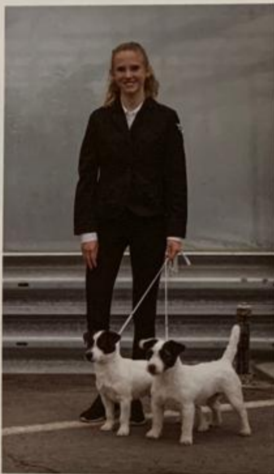
Jack Russell Terrier, blanc avec des marques noires. Meilleur Couple de l'exposition

ou dur, est dense et assez résistant aux intempéries. Il doit être brossé régulièrement. Les poils morts peuvent être épilés à la main, on parle d'une toilette naturelle de la robe. Pourtant il ne faut jamais le tondre, le Russell Terrier n'est ni un agneau ni un caniche.