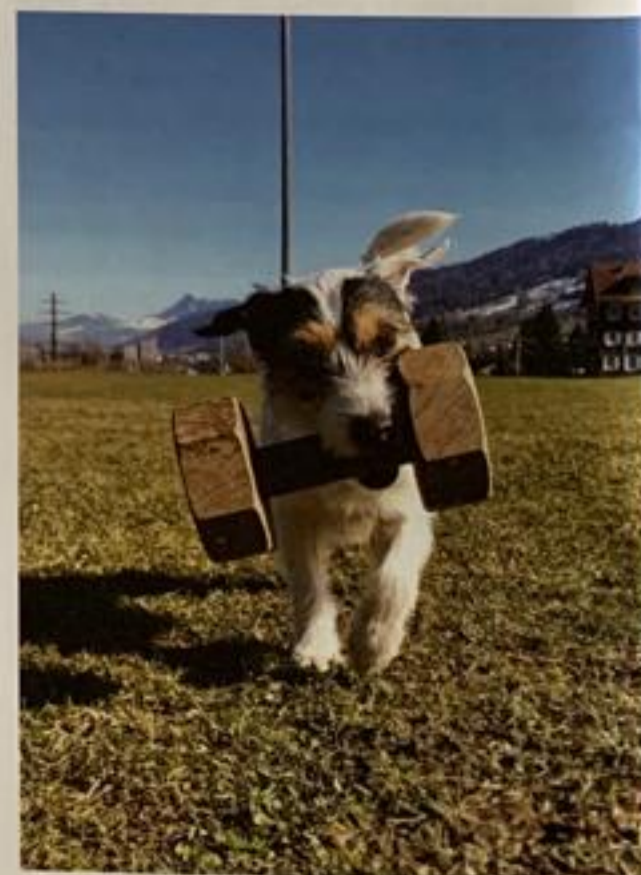
Le jeune chien prend du plaisir à apporter