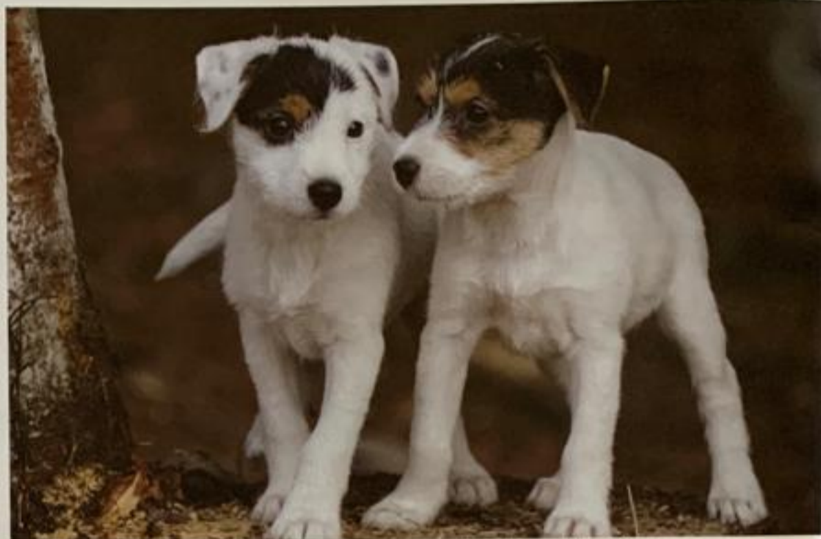
2 chiots âgés de 10 semaines, Parson Russell Terrier, poil dur, tricolore

Né en 1795 à Dartmouth dans le Devon, en Angleterre, le révérend John Russell (son véritable prénom, mais surnommé Jack par ses amis) fut un chasseur très passionné et un éleveur averti qui a laissé son nom à un petit terrier plein de vie et d'intelligence qui a