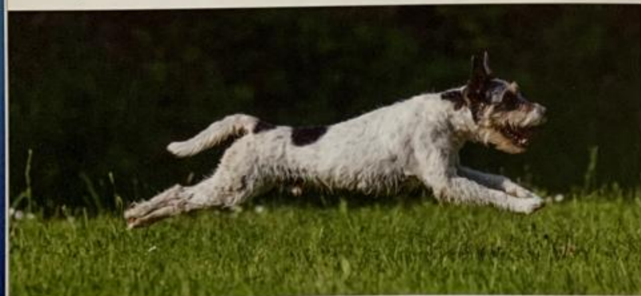
Mâle adulte en action au galop (phase d'envol)