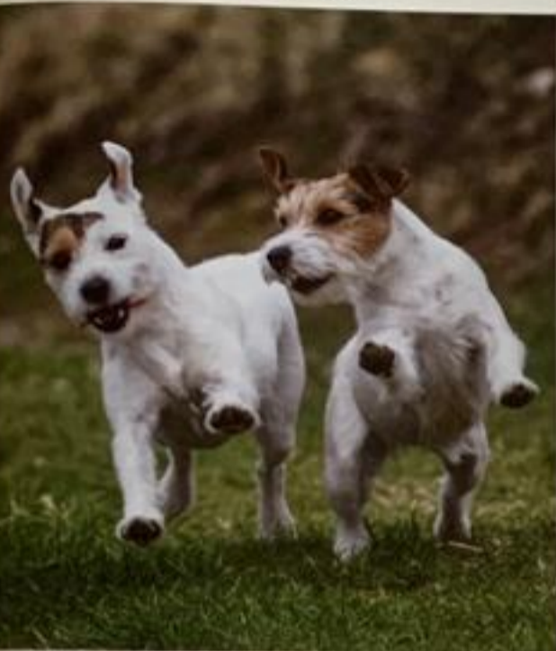
2 Parson Russell Terrier adultes, tricolores

groupe FCI 3, Terriers, Section 2 : Terriers de petite taille, son pays d'origine est la Grande Bretagne. L'Australie est le pays de développement. Son nom d'origine en anglais est Jack Russell Terrier. La taille idéale au garrot pour les deux sexes est de 25 à 30 cm.